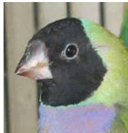
Μαυροκέφαλο θηλυκό: Μια αμυδρή πρασινωπή - μπλε γραμμή χωρίζει το μαύρο κεφάλι από την πράσινη πλάτη (Προσέξτε το σκοτεινό-μαυρισμένο ράμφος)