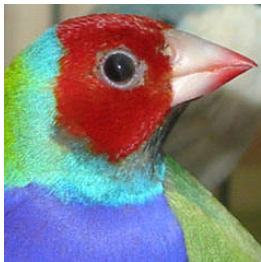
Κοκκινοκέφαλο αρσενικό: Ένα πολύ καθαρό χρώμα σε όλο το κεφάλι

Στα κόκκινα και κίτρινα χρωματισμένα στο κεφάλι πουλιά, θα διαπιστώσετε ότι τα αρσενικά έχουν ένα πλούσιο βαθύ καθαρό χρώμα, ενώ τα θηλυκά τείνουν να έχουν πιο αμυδρά χρωματισμένα κεφάλια και μαύρα "γυαλιά" γύρω από τα μάτια, στο χρωματισμό της κεφαλής, ειδικά γύρω από το ράμφος, κοντά στα μάτια και στις άκρες της μάσκα.