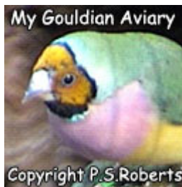
Κίτρινοκέφαλο θηλυκό: Σκοτεινότερο κίτρινο με πιο μαύρο γύρω από και μέσα στη χρωματισμένη μάσκα.

4 η Ένδειξη : Φωτεινό καθαρό κόκκινο ή κίτρινο κεφάλι = Αρσενικό