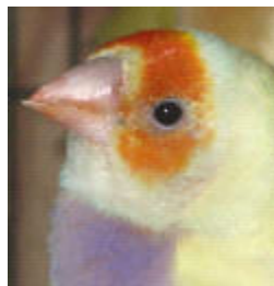
Κοκκινοκέφαλο κίτρινο θηλυκό: Άσπρα στίγματα φτερών στη μάσκα, με περισσότερα γύρω από το ράμφος.