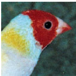
Κοκκινοκέφαλο κίτρινο αρσενικό: Ένα πολύ καθαρό χρώμα σε όλο το κεφάλι

Αυτή η μέθοδος είναι επίσης αληθινή στα κίτρινα χρωματισμένα στην πλάτη πουλιά αλλά τα μαύρα σημεία αντικαθίστανται από το λευκό στη μάσκα του θηλυκού.