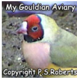
Κοκκινοκέφαλο θηλυκό: Σκοτεινότερο κόκκινο με πιο μαύρο γύρω από και μέσα στη χρωματισμένη μάσκα.