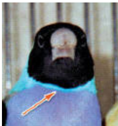
Μαυροκέφαλο μπλε αρσενικό: Φωτεινό μπλε χρώμα κάτω από το πηγούνι.